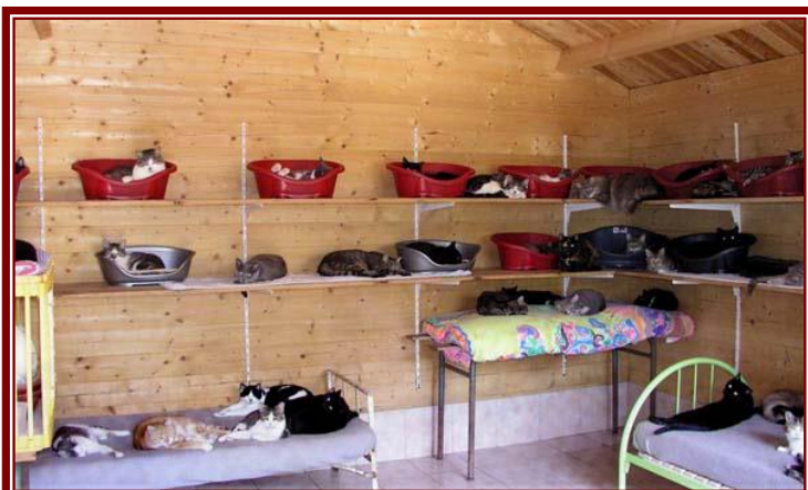
Aperçu de l'intérieur d'un des chalets, lits, paniers, chacun sa place et une place pour chacun.

(*) Le Fonds de Dotation : Article 140 de la loi n°2008-776 du 4 août 2008 de modernisation de l'économie.